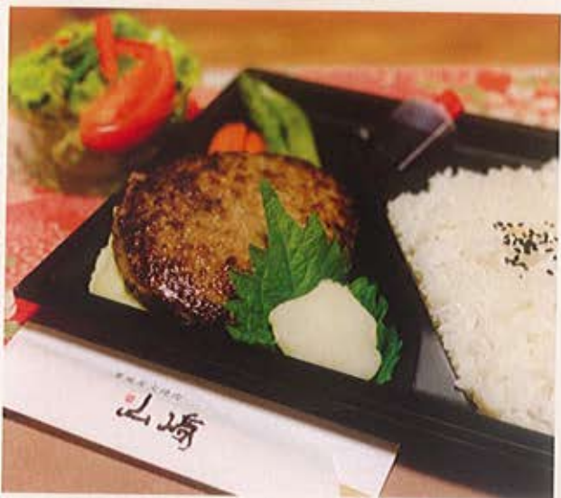
黒毛和牛100%のジューシーな美味しさ

黒毛和牛ハンバーグ弁当 ハンバーグ/ご飯/サラダ おろしばん酢orオニオンソース 1,680円 (税込)