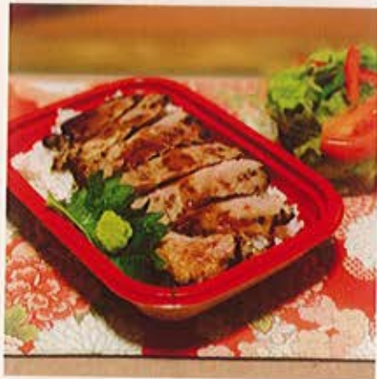
自家製のタレが食欲をそそる