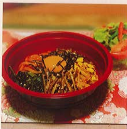
人気のビビンバをご家庭でどうぞ