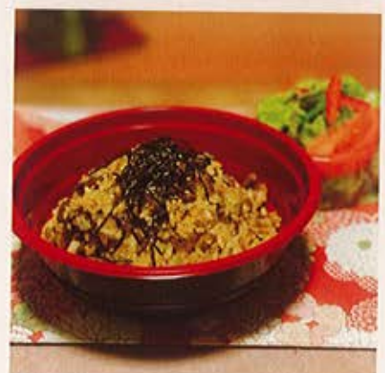
当店特製 石鍋で香ばしく焼き上げた鶏めし